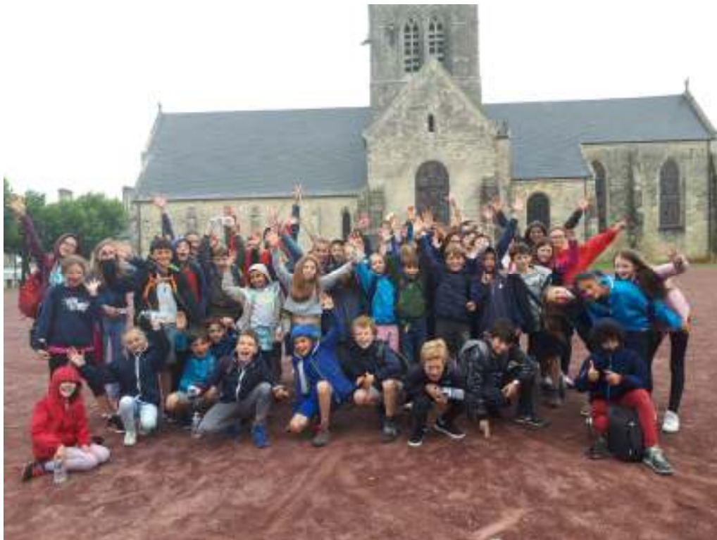
Sainte Mère l'Eglise