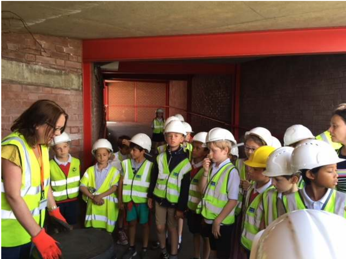
Les CE2 A