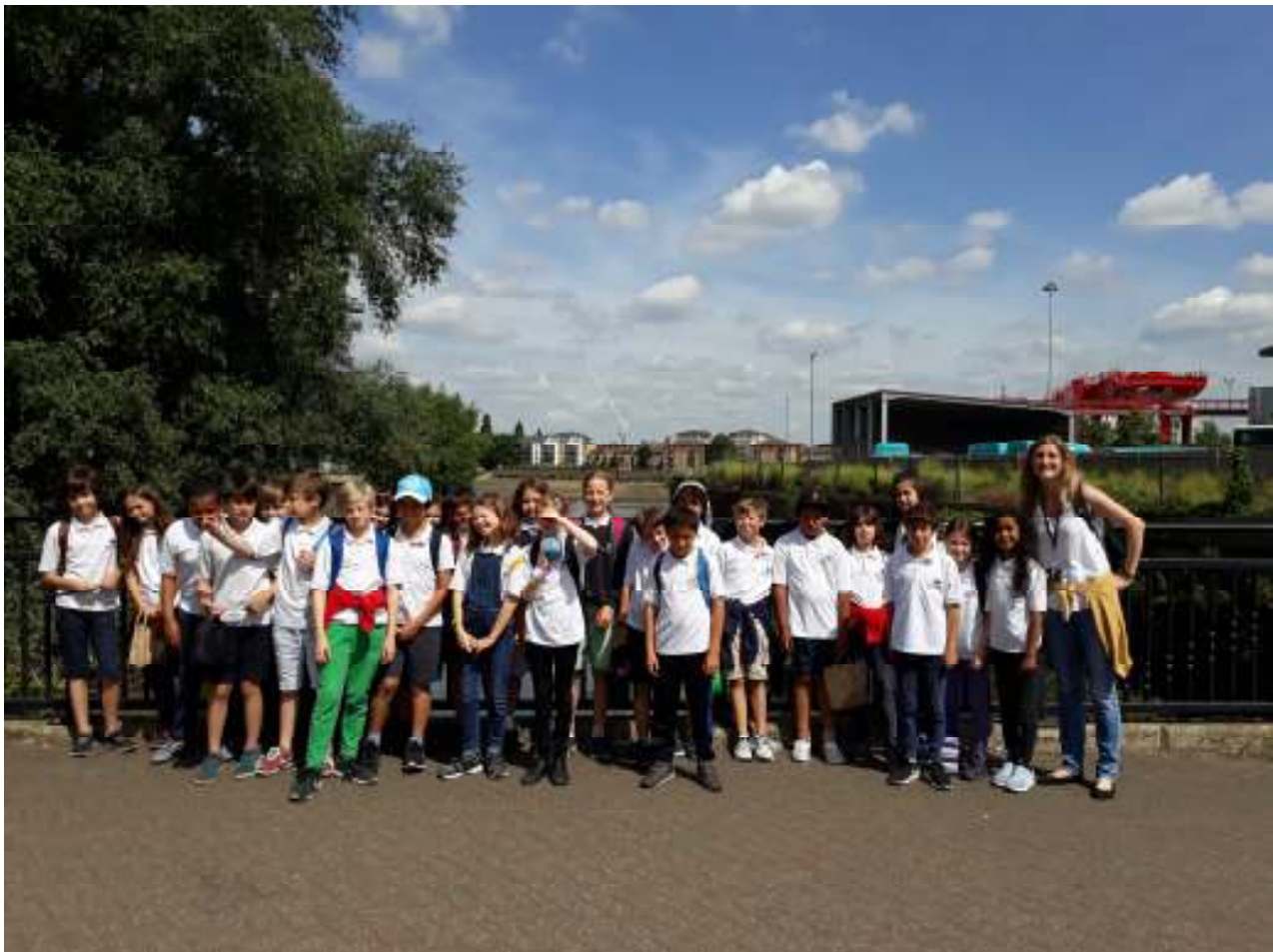
Les CM1 B