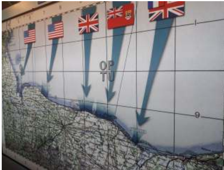
L'opération Overlord 6 juin 1944

Les deux classes de CM2 se sont rendues en Normandie sur les traces du débarquement. Ce voyage a été encore une fois un beau succès unanimement apprécié des professeurs et des familles.